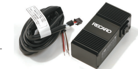
ナビシートセクター

※取り付けに際しては、専門的な知識が必要となりますので、RECARO正規取扱販売店にご相談ください。