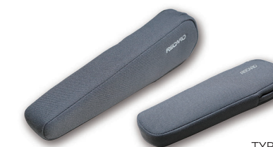
TYPE-EN Nardo Gray